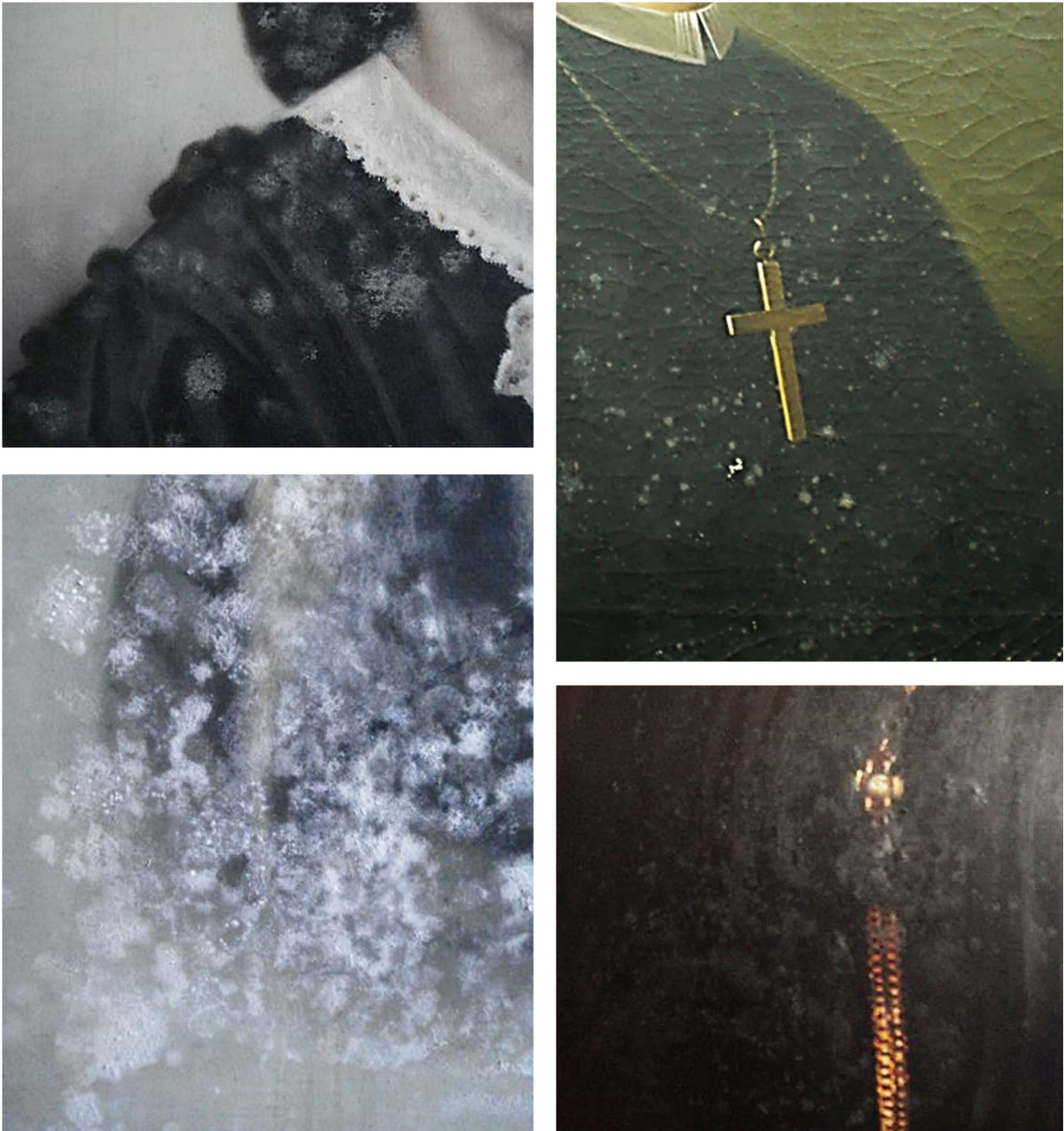
Figura 1. Pinturas de cavalete de Giorgio Marini com evidentes sinais de proliferação microbológica.

(Motic BA410E) e as imagens adquiridas com câmara fotográfica MoticamPro 282B.